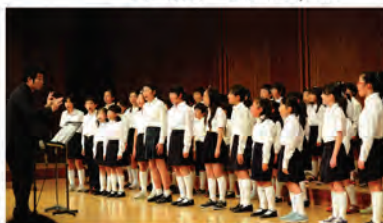
港区立三光小学校・神応小学校 合同合唱団