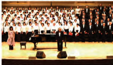
合唱団「萩」/ジャパンコーラルハーモニー