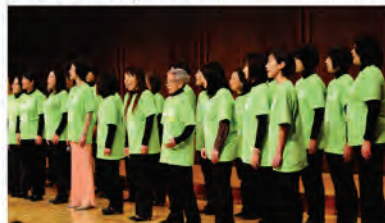
また華が咲く合唱団